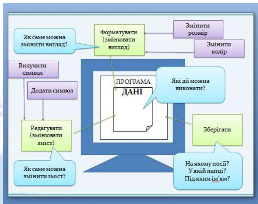
Рис.3. Орієнтовний вигляд частини результатів діяльності

Поданий приклад демонструє застосування одного з можливих методів навчання, у яких учитель виступає не носієм знань, а тільки організовує процес їх самостійного здобуття, спрямовує й координує навчально-пізнавальну діяльність, знаходячись у постійному діалозі з учнями.