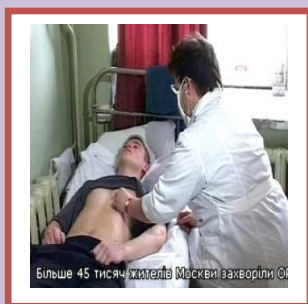
Більше 45 тисяч жителів Москви захворіли на грип